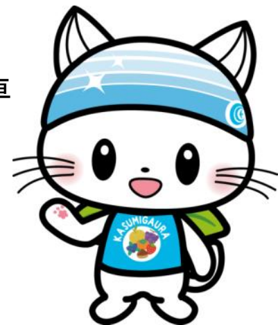
公式キャラクター 「かすみがうにゃ」