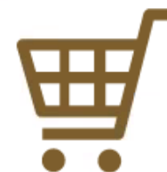
つくば・印西の 大型ショッピングモール