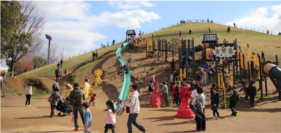
大型遊具がある「たつのこやま」