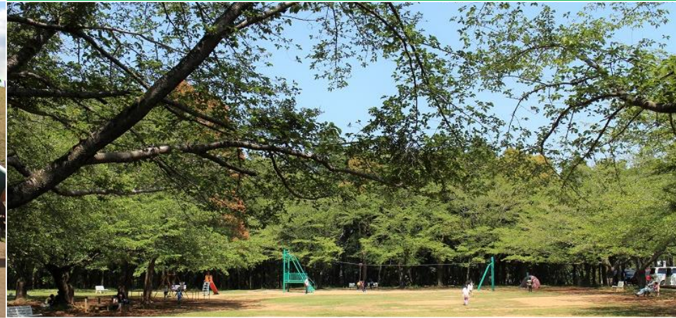
森の中にある「森林公園」