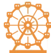
東京-千葉 臨海エリア