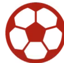
鹿島アントラーズ