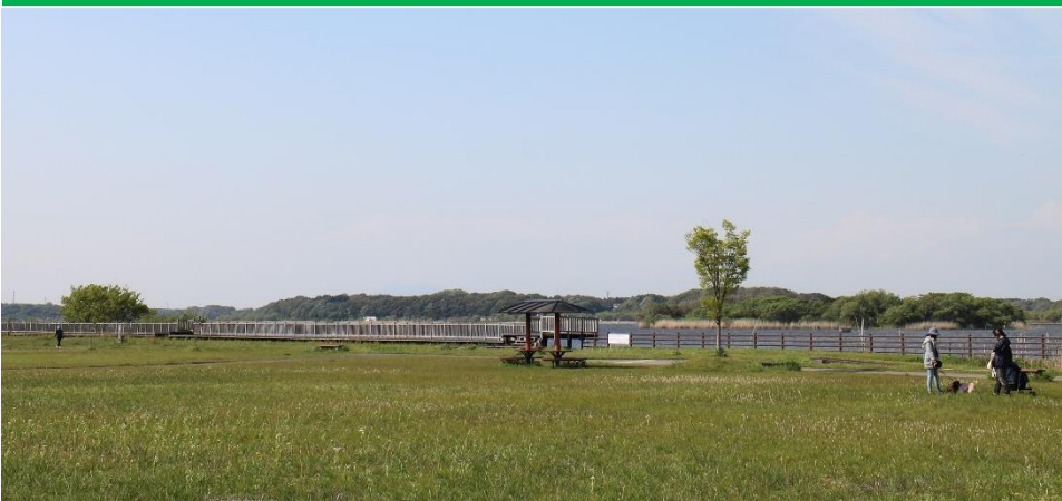
白鳥が泳ぐ「牛久沼水辺公園」